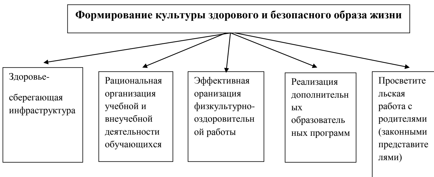
Рисунок 2 – Структура системной работы по формированию культуры здорового и безопасного образа жизни

Здоровьесберегающая инфраструктура школы описана следующими